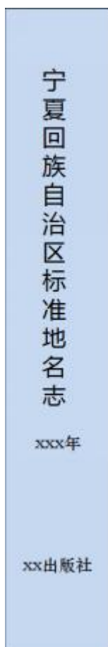
图 A. 2 书脊尺寸及排版