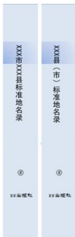
图3 标准地名录书脊样式